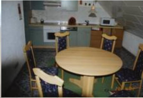
Komplett ausgestattete Küche mit Ceranfeld, Herd, Mikrowelle, Geschirrspüler, Waschmaschine, Sat-TV, Kühlschrank mit Gefrierfach und Essplatz