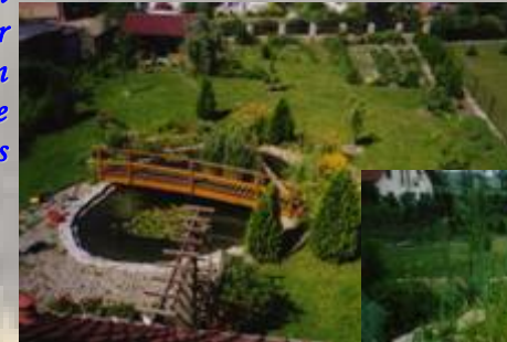
Großer gemütlicher Garten mit Terrasse zur Mitbenutzung