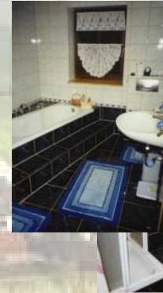
Badezimmer (Wanne, Dusche, WC)